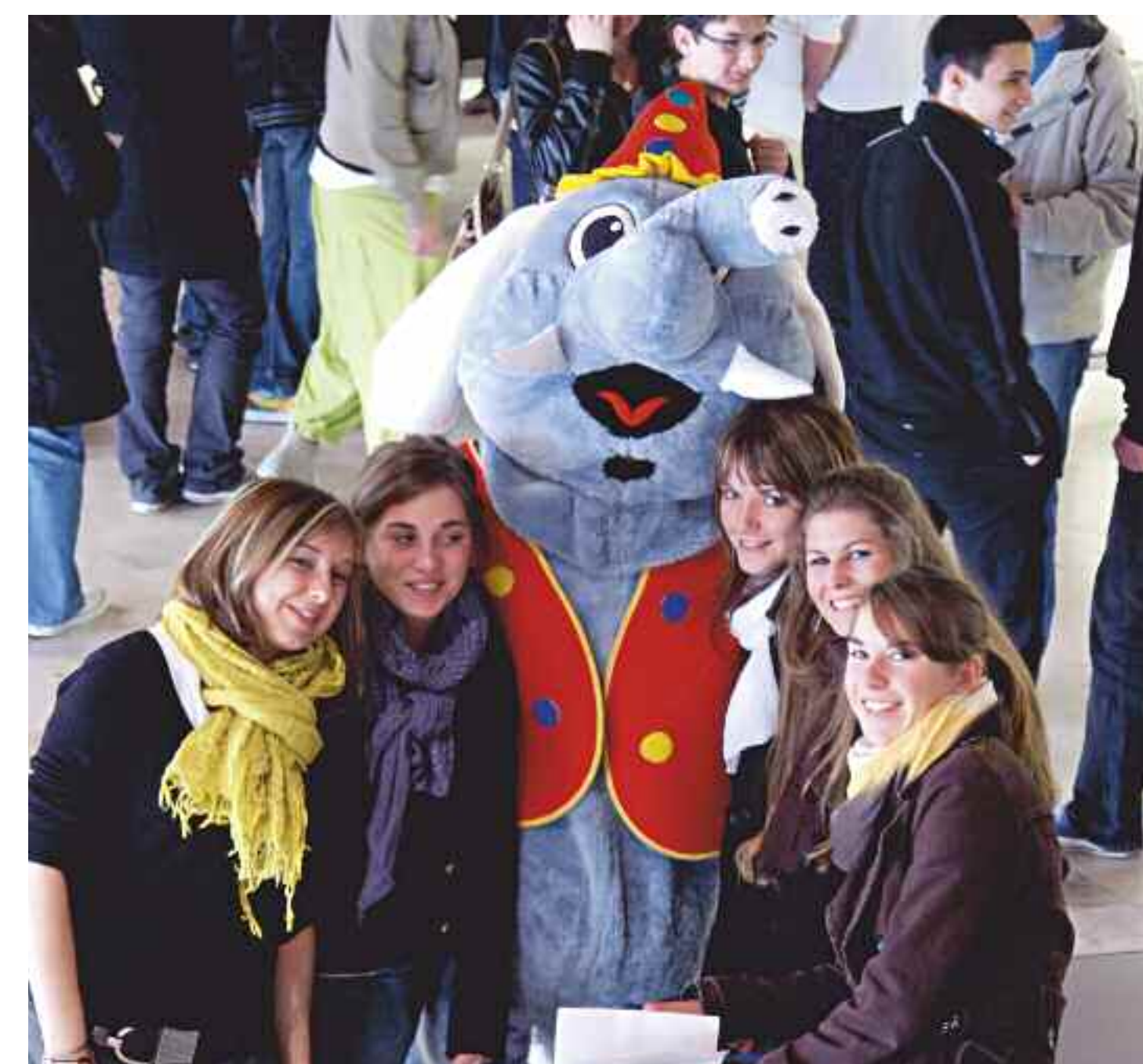
Accueil de la cordée de la réussite 2009 à Télécom Bretagne

Les lycéens viennent début avril dans les établissements d'enseignement supérieur pour s'imprégner de l'ambiance des laboratoires de recherche et voir les lieux de vie et d'étude des étudiants.