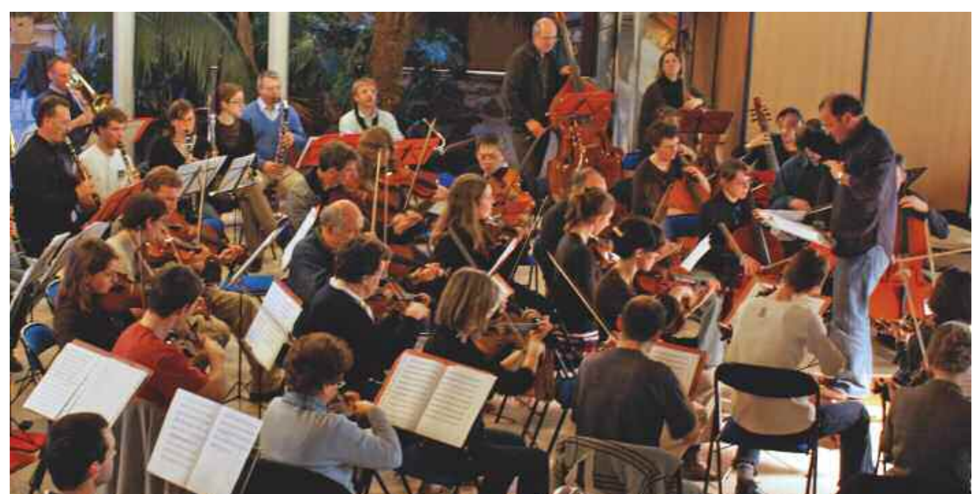
Répétition exceptionnelle de l'orchestre de l'UBO, à Télécom Bretagne, durant la cordée de la réussite 2009